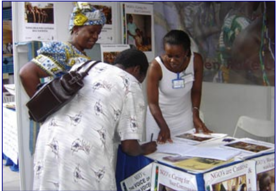
Wawakilishi wa AZAKi katika harakati za Ushawishi

Matokeo yanayopatikana kutokana na utafiti huo yamekuwa muhimu katika utendaji wa