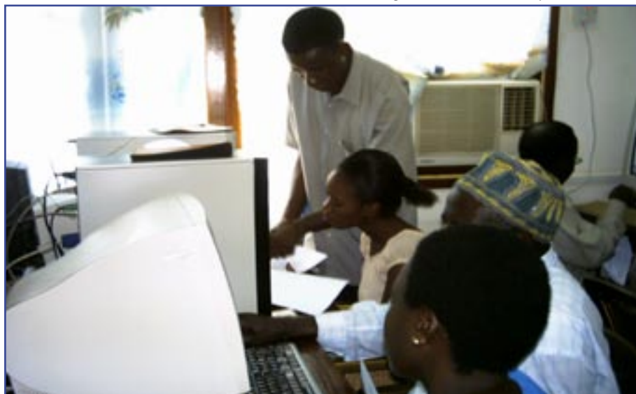
Wawakilishi wa AZAKi wakifuatilia mafunzo ya kompyuta

Tatizo jingine kubwa ni kwa viongozi wengi wa AZISE kuwa katika mashirika mengi, hali hii husababisha kuwepo kwa udhaifu wa kiutendaji, kutokuwepo kwa ubunifu na moyo wa kujituma na ufanisi. AZISE nyingine huendeshwa kindugu, hapo mwanzilishi hayupo tayari kutoa nafasi sawa za watendaji wenye taaluma, badala yake hujikuta anabaki na ndugu zake wasio na ujuzi.