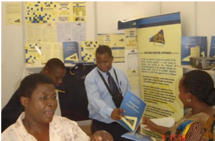
Maonesho ya AZAKi Bungeni Dodoma

Maonesho ya kwanza yalifanyika Julai 2004 na yaliandaliwa kwa ushirikiano kati ya Foundation na Chuo Kikuu cha Kitaifa New York (SUNY) na kufadhiliwa na Wakala wa Kimaendeleo ya Kimataifa wa Marekani (USAID)-chini ya Mpango wa Ufadhili wa Kuimarisha Bunge na yalihudhuriwa na wabunge wapatao 200 na zaidi ya AZAKI 60.