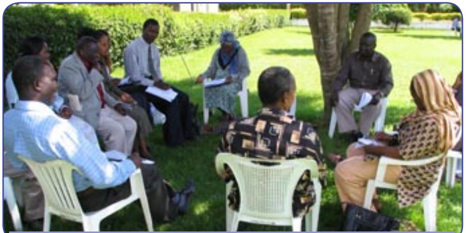
Majadiliano ya vikundi ni njia moja ya kukuza uwezo wa AZAKi

Mikakati ya muda wa kati ni pamoja na kuboresha njia za mawasiliano kwa kuwezesha kuwepo kwa vituo vya habari katika kila wilaya, kuboresha mahusiano kati ya AZAKi na serikali za mitaa kupitia midahalo.