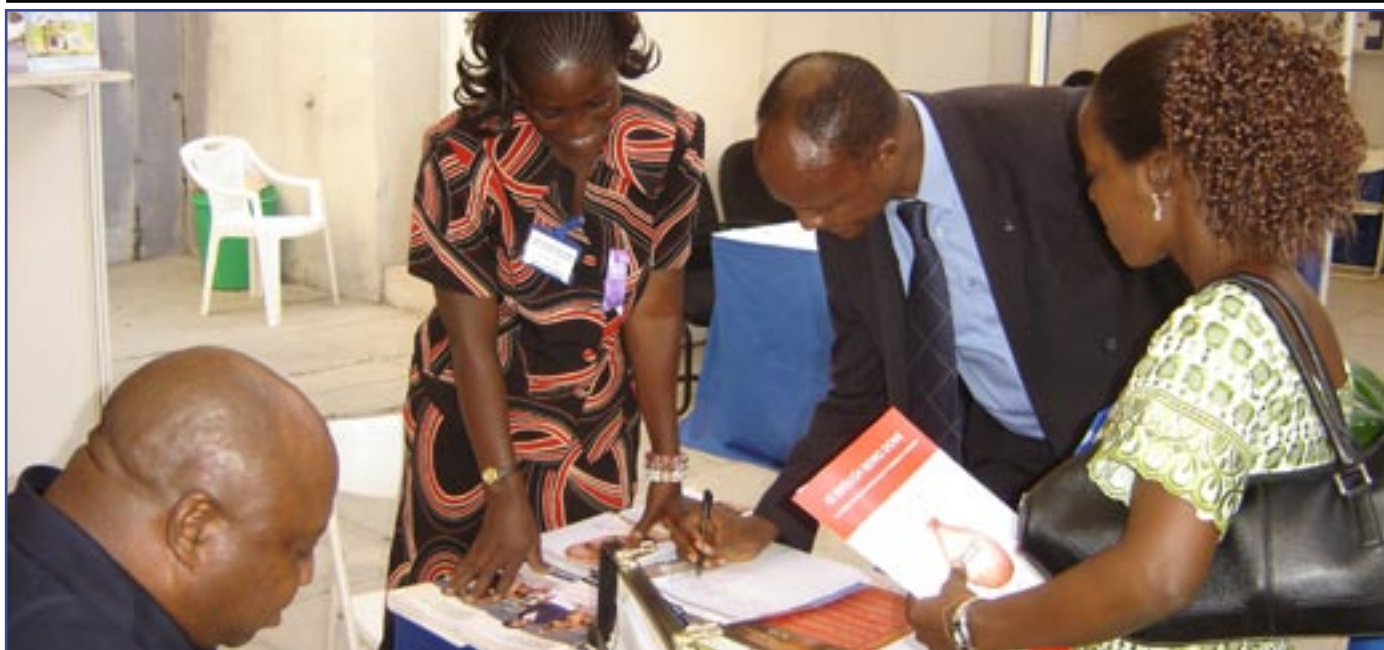
Wawakilishi wa mashirika ya kutetea haki za afya (Health Equity) wakizungumza na Wawakilishi wa Wananchi mjini Dodoma