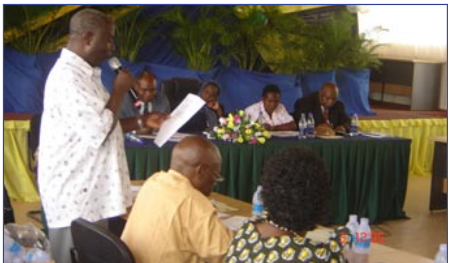
Baadhii ya washiriki wa mdahalo wa Ulingo wa Maendeleo Shinyanga