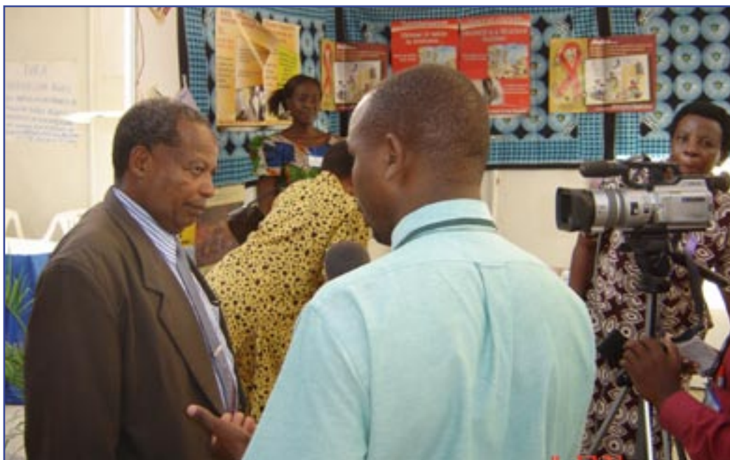
Maonesho ya AZAKi Bungeni Dodoma

Mawasiliano rasmi na Baraza la Wawakilishi na AZAKi za Zanzibar zikiongozwa na ANGOZA na UWZ, ikiwa ni sehemu ya mchakato wa maandalizi yanafanyika. Jumla ya AZAKi 50 kutoka visiwa vyote vya Zanzibar zinatarajiwa kuhudhuria maonesho.