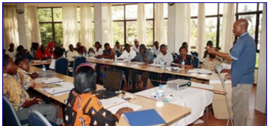
Wawakilishi wa AZAKi katika moja ya mafunzo ya kujengewa uwezo yaliyofanyika DSM

Utafiti wa mwaka huu unatarajiwa kuanzisha mchango wa the Foundation katika kufanikisha Mkakati wa Taifa wa Kukuza Uchumi na Kupunguza Umasikini (MKUKUTA) na Mpango wa Kupunguza Umasikini Zanzibar (MKUZA) na malengo ya milenia (MDGs).