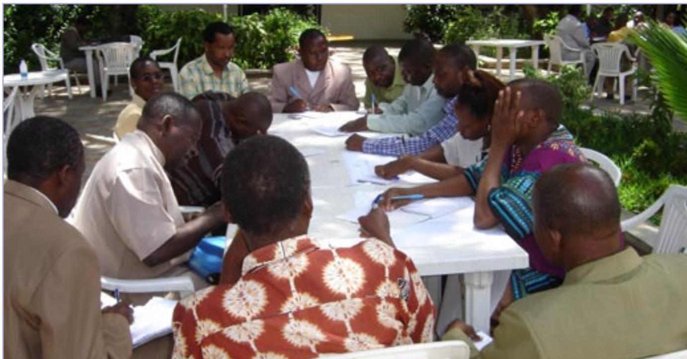
Baadhi ya wawakilishi wa mitandao ya AZAKI nchini wakiwa katika majadiliano

Maandalizi ya kufanya utafiti huo yameambatana na kuundwa kwa kamati ndogo ya ushauri. Kamati hiyo ina wawakilishi kutoka mitandao miavuli ya asasi za kiraia ikiwemo TANGO na TACOSODE, mashirika mengi yanayotoa mafunzo kwa AZAKI; PACT Tanzania, SNV, DEED na Baraza la AZISE. Wawakilishi wengine wanatoka katika Kitengo cha Uratibu wa AZISE na idara nyingine za serikali.