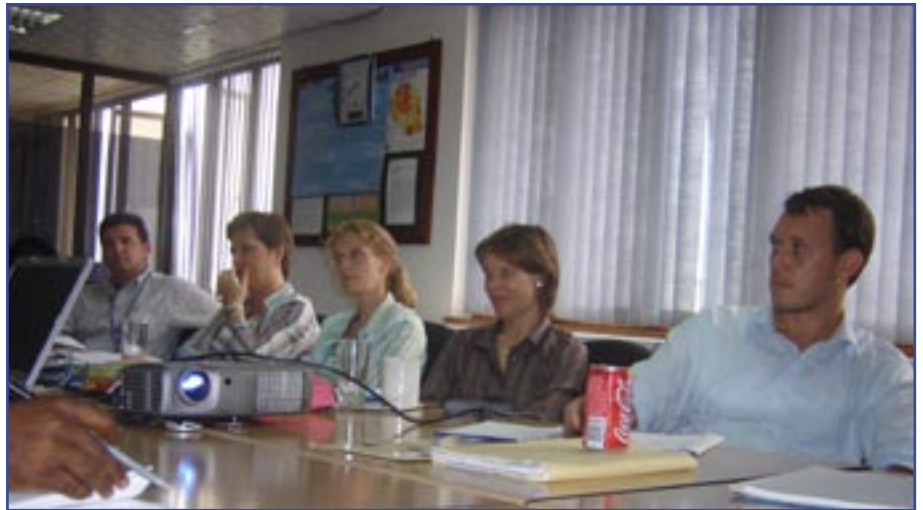
Baadhi ya Wabia wa Maendeleo katika Mkutano wa pamoja na the Foundation

Hata hivyo, wadau hao walisema hatua hizo zitawezekana ikiwa Fthe oundation itayatangaza mafanikio ya huduma zake na ya asasi za kiraia, na hivyo walipendekeza kuwa ukusanyaji na uchapishaji wa taarifa za mafanikio ya asasi za kiraia ufanyike mara kwa mara.