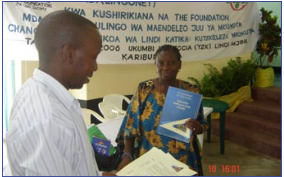
Washiriki wa Mdahalo wa Ulingo wa maendeleo mkoani Lindi wakiangalia fomu na mwongozo wa maombi ya ruzuku zinazotolewa na the Foundation

hizo kutoka kwenye mtandao huo kwenye maeneo yenye huduma ya mtandao wa mawasiliano, maarufu kama internet na hivyo kupunguza muda na gharama zilizokuwa zikitumika kuchukua fomu na kusambaza fomu kwa waombaji wa ruzuku.